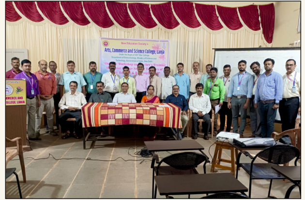
DBT STAR Junior College Teacher's Training Programme