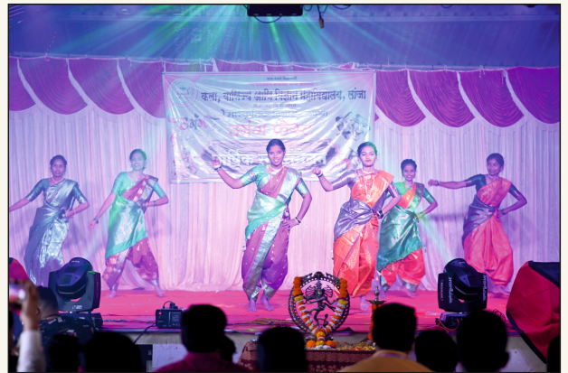
उमंग फेस्ट - वार्षिक स्नेहसंमेलन