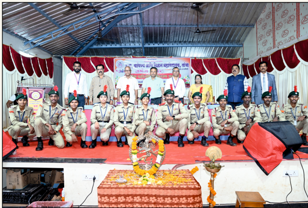
महाविद्यालय एन. सी. सी. युनिट पथसंचलन जिल्हास्तरीय प्रथम क्रमांक