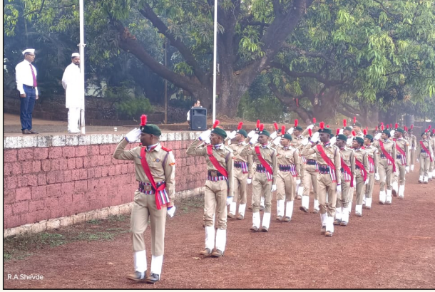
महाविद्यालय एन. सी. सी. युनिट पथसंचलन करताना