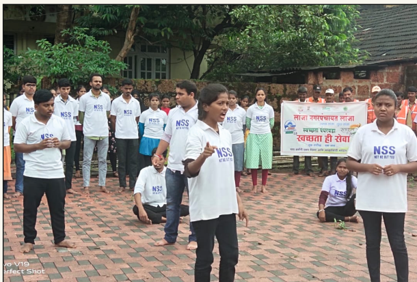
पथनाट्य सादर करताना एन.एस.एस. विद्यार्थी