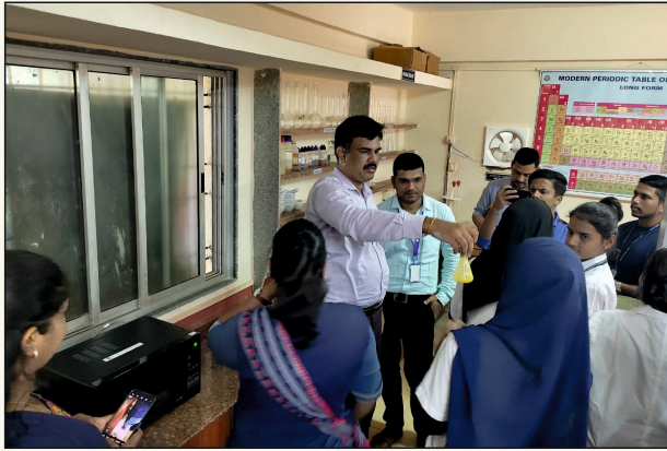
DBT STAR College Scheme Programme