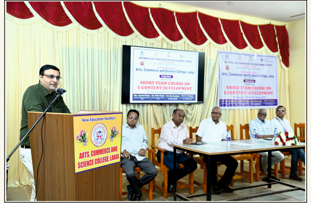
MMTTC मुंबई विद्यापीठ आणि महाविद्यालय आयोजित STC - E-Content Development